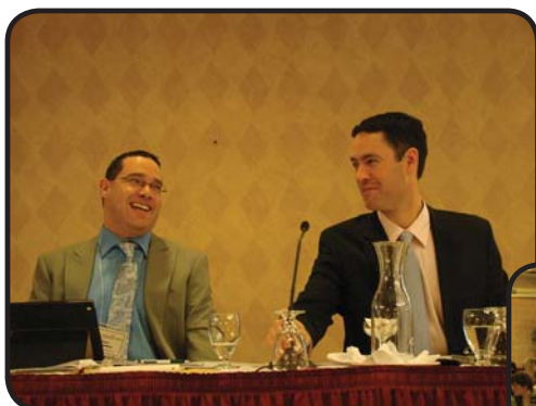
La bonne humeur règne à l'AGA des ÉFM!