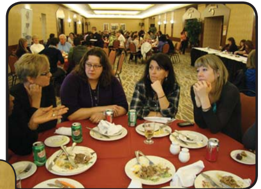
...beaucoup de discussions autour de la table!