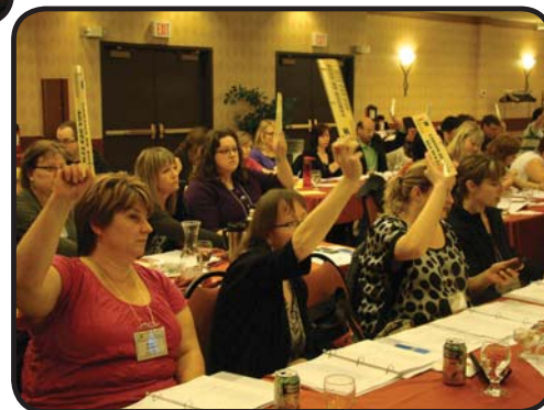
... la démocratie en action!