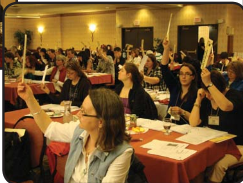
Tous en faveur! Adopté...