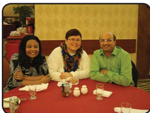
Des membres dévoués!