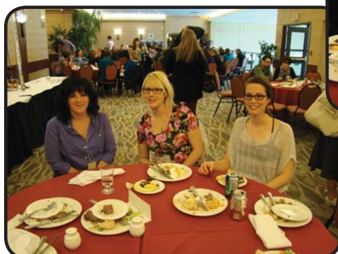
D'la belle visite pour les ÉFM!