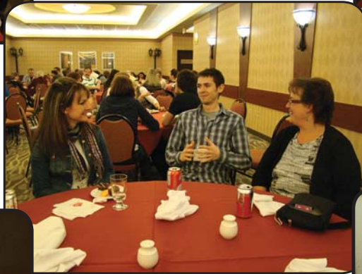
Encore des discussions!