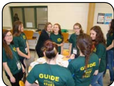
Les élèves du Institut collégial Miles Macdonell étaient là pour aider les participants au Symposium