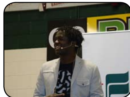
« Vous, les enseignants, jouez un rôle vital dans l'évolution de vos élèves : vous modelez leur identité!