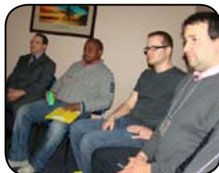
Une petite pause pour relaxer!