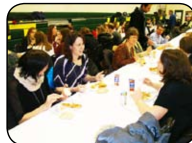
On mange et on échange!