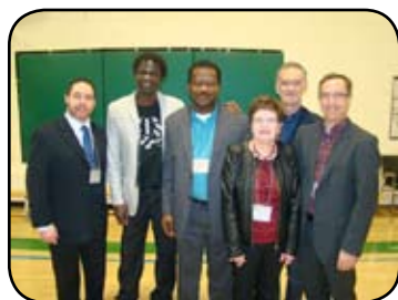
De la bien belle visite!