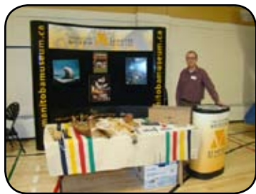
Le Musée du Manitoba figurait parmi les exposants