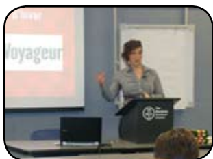
Hé! Ho! Nous avons eu la visite du Festival!