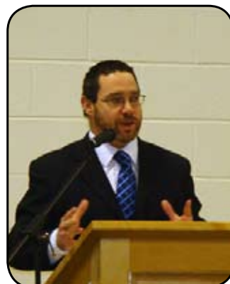
Bienvenue au Symposium!