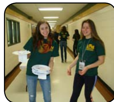
Des ambassadrices exceptionnelles !