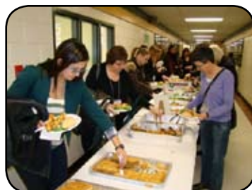
Hmmm... les brochettes au poulet sont toujours populaires!