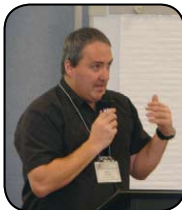
Martin invite les membres à participer en grand nombre aux activités du Comité de sensibilisation et de promotion!