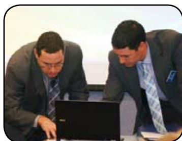
Ah!... la technologie!