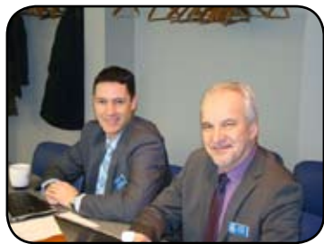
À votre service!