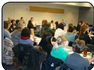
Il y avait foule, en ce très froid matin de janvier!