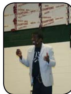
« Comme le disait mon grand-père... »