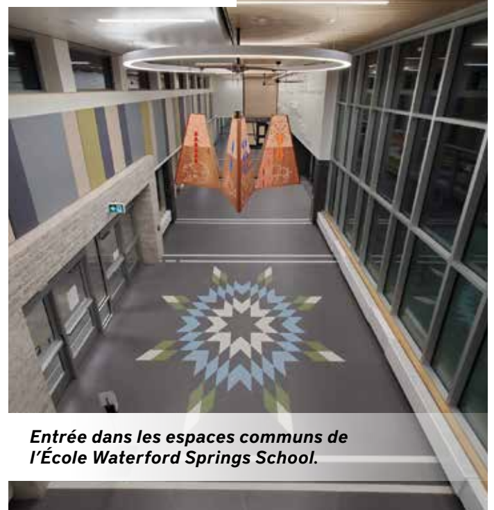
Entrée dans les espaces communs de l'École Waterford Springs School.