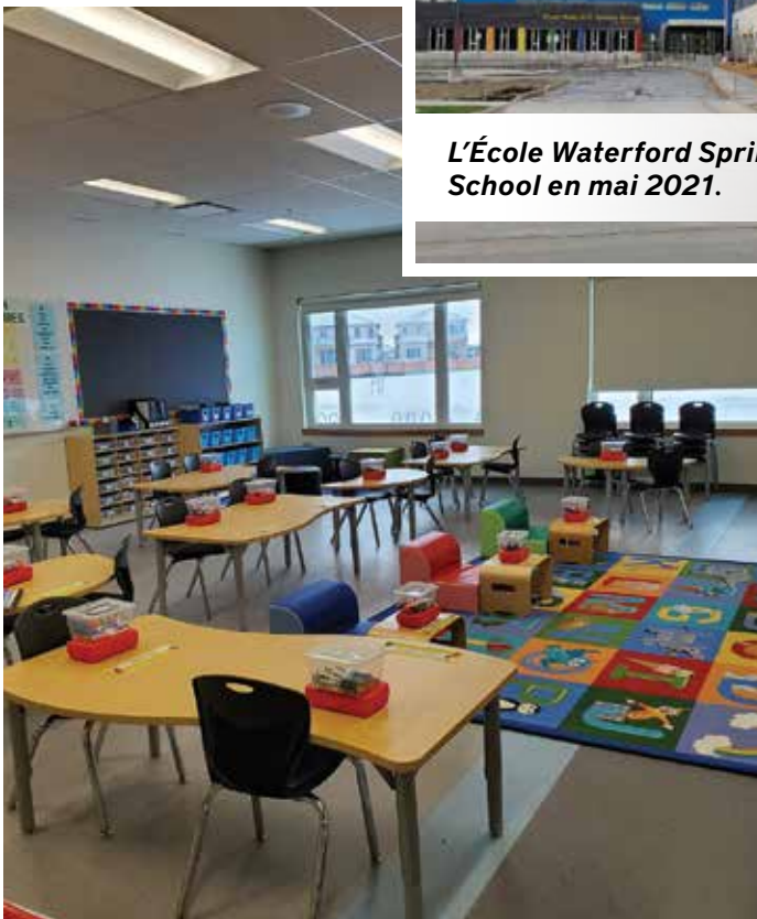
Une classe primaire typique à l'École Waterford Springs School.