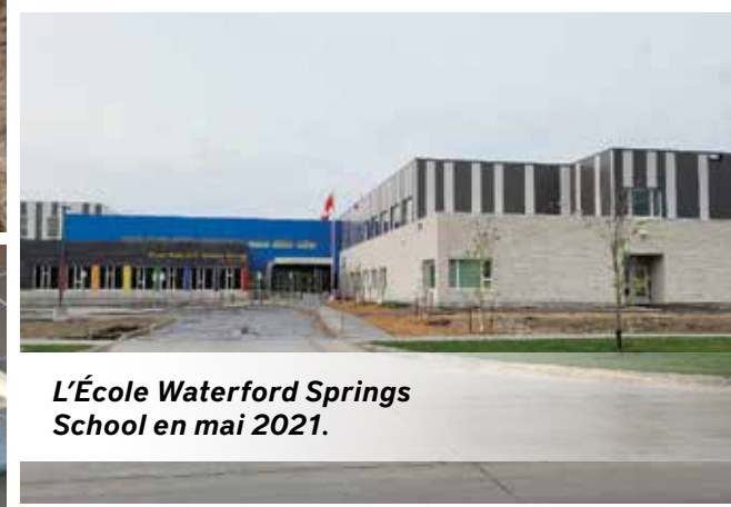
L'École Waterford Springs School en mai 2021.